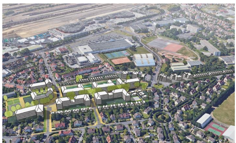
Vue contextuelle du projet