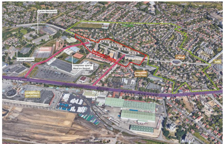
Vue aérienne du site et contexte urbain

Le quartier des Arcades Fleuries est situé à 18 km à l'est de Paris à vol d'oiseau. Le territoire du projet s'insère dans un contexte paysager urbain à dominante pavillonnaire jouissant d'un cadre de vie de grande qualité. En revanche, le patrimoine s'avère vieillissant et doit faire l'objet de réhabilitation lourde. ICF Habitat La Sablière est engagé dans une démarche de production de logements de qualité.