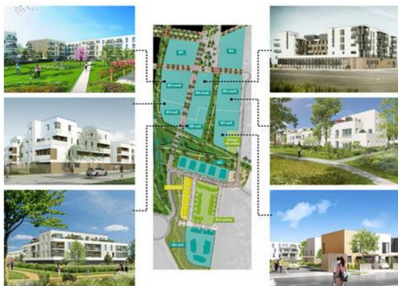
Le projet- Bécard-map

Cette mission a pour objectif le respect du règlement de chantier propre élaboré par Grand Paris Aménagement, en étant attentif à la tenue du site et en relevant les dysfonctionnements ainsi que les mesures correctives qui doivent être mises en place. Le suivi se fait mensuellement, à travers une visite de site, la récolte de tous les documents attendus (SOGED, plan de management environnemental, BSD etc.) et un compte rendu détaillé envoyé à chaque responsable.