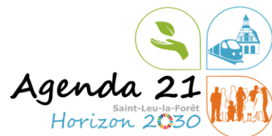
Logo de l'Agenda 21 – Vizea, 2019

Tout l'enjeu de la mission effectuée par Vizea est d'insuffler une vision du Développement Durable qui soit systématiquement considérée dans les décisions municipales et qui s'inscrive dans la stratégie de la ville. Pour cela, la vision d'un Saint-Leu-la-Forêt plus durable doit être partagée avec les habitants et les services de la ville, dans le cadre d'une concertation tantôt participative, tantôt implicite, mais toujours mobilisatrice.