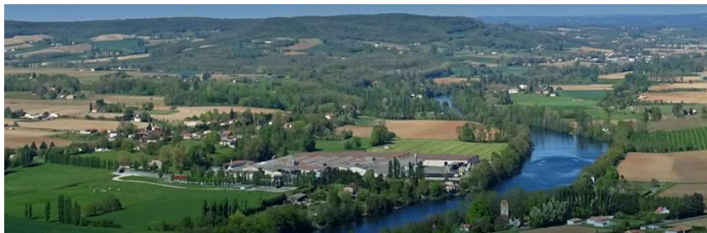
PHOTO DU TERRITOIRE

La CCFVL est un territoire varié assez rural avec un patrimoine naturel et historique à préserver et valoriser, comme les plusieurs sites Natura 2000 ou encore ses nombreux monuments historiques . En matière climatique et énergétique, certains enjeux territoriaux sont très marqués. La prédominance de la voiture dans ce territoire très dense ou encore l'ancienneté du parc résidentiel individuel ( près de 52% des logements antérieurs 1970 ) très consommateur d'énergie font partie des points auxquels le PCAET devra répondre.