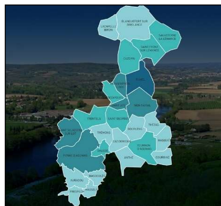
CONSOMMATIONS D'ENERGIE FINALE ET EMISSIONS DE GES DU TERRITOIRE

Ville centre du territoire, FUMEL, est située à 55km du réseau autoroutier de l'A62 et L'A20. Distant de 55 km Fumel, de 155 km de Bordeaux (2h14), et également située à 156 km de Toulouse (soit 2h).