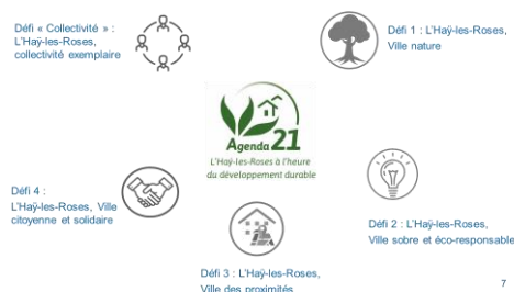
Défis thématiques de l'Agenda 21

L'Haÿ-les-Roses : Agenda 21 : 5 défis à relever !