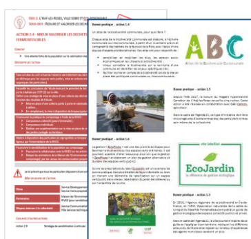
Exemple de fiche action

Au total, 344 personnes ont été sensibilisées ou concertées via la concertation Agenda 21.