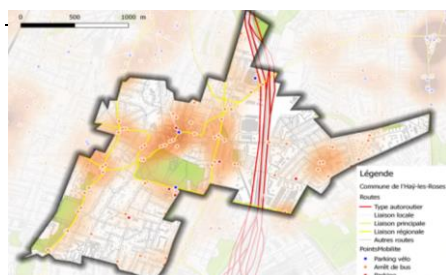
Élément de diagnostic : étude des polarités de la commune

Animation d'un atelier de travail avec les élus « Prospective et environnement stratégique », à partir de titres de journaux fictifs