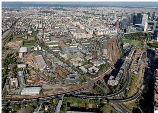
Vue aérienne du territoire de l'EPADESA