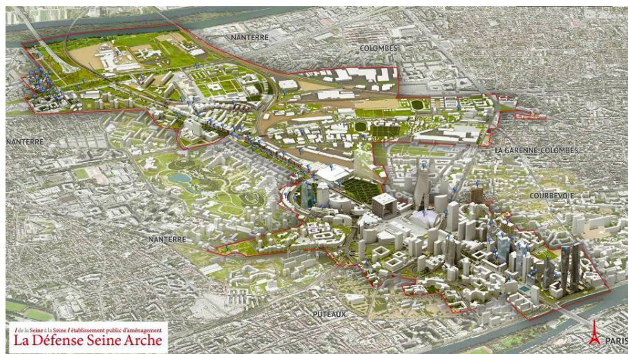
Projets portés par l'EPADESA sur son territoire

- Synthèse et analyse des enjeux de territoire, des enjeux des projets et du benchmark et définition des grands axes et objectifs de la stratégie de développement durable.