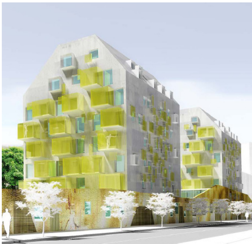
Perspective la crèche et des logements depuis la rue Davout