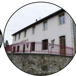
« Centre Social » de Viry et la mairie de Choux