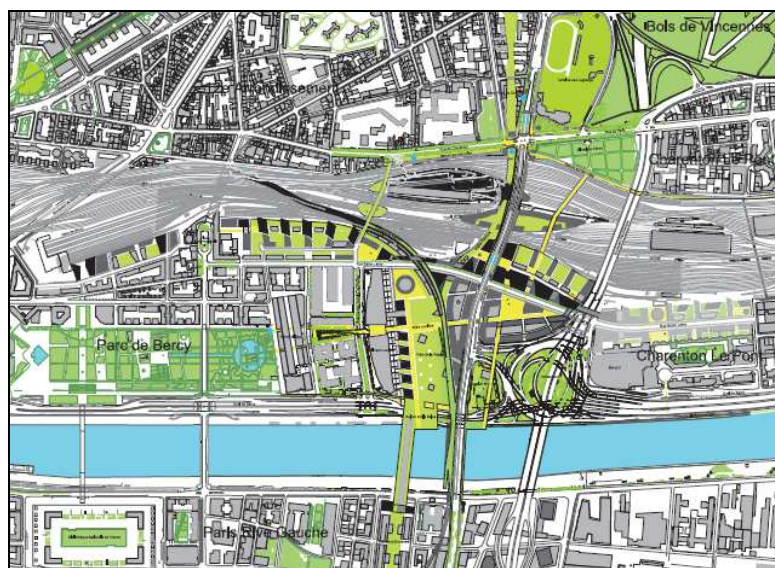
Plan masse du secteur Bercy-Charenton (Plan Guide - 2012)