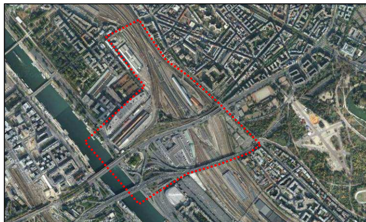
Vue aérienne du secteur Bercy-Charenton