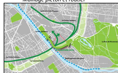
Trame des espaces verts