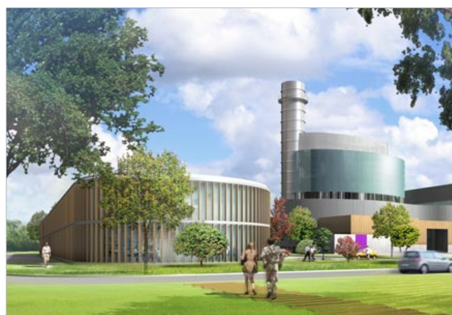
Perspective du projet