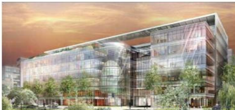
ZAC des bords de Seine - Projet du futur siège de BNP Paribas immobilier 2

Dans le cadre de projets d'aménagement du quartier Carnot-Gambetta, où 5 opérations majeures et plusieurs opérations de construction de logements sont en cours, la ville de Suresnes souhaite étudier les conditions de mise en œuvre d'une démarche exemplaire en matière de construction durable, d'efficacité énergétique et de réduction des émissions de gaz à effet de serre, à l'échelle de ce quartier pilote.