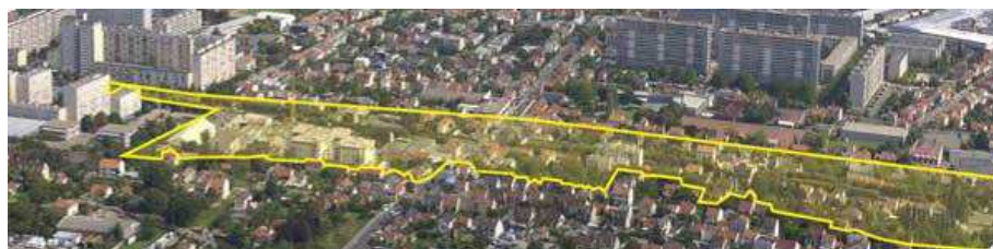
Plan de la ZAC