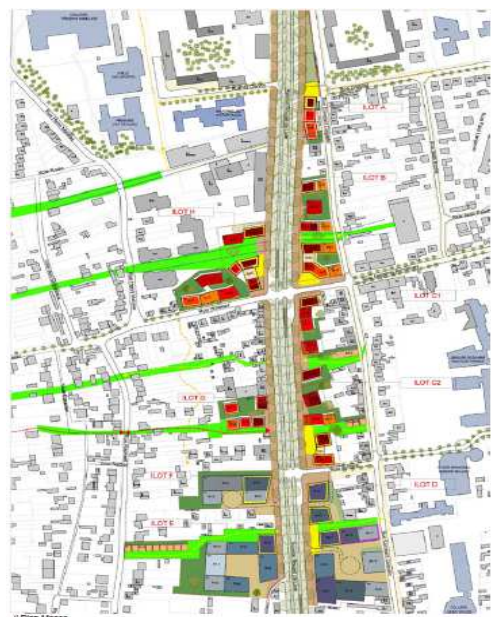
Plan masse - Archikubik

D'une superficie de plus de 9Ha, la ZAC Rouget de Lisle s'inscrit dans le périmètre de « l'éco-quartier RD 5/Vitry Sud Ardoines et dans la dynamique territoriale de la Grande Opération d'Urbanisme d'Intérêt National « Orly Rungis Seine Amont ». LesEnR accompagne la maîtrise d'ouvrage dans la définition des enjeux et objectifs développement durable du projet et assiste la maîtrise d'œuvre urbaine dans la définition du projet urbain.