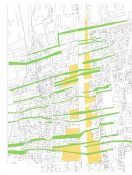
Eco-connecteurs - Archikubik