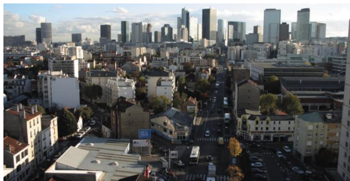
PHOTO DE LA GARENNE ET DE LA TYPO MORPHOLOGIE DE L'HABITAT