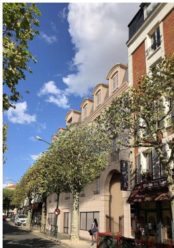
PERSPECTIVE 3D D'UN PROJET IMMOBILIER A LA GARENNE