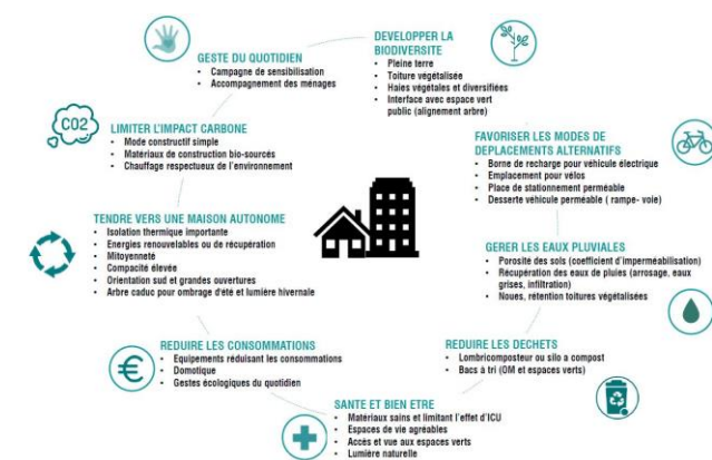
SYNTHESE DES LEVIERS D'INTERVENTIONS ENVIRONNEMENTAUX