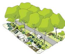
3. Les allées des mas