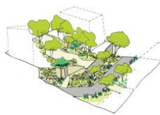
2. Les terrasses habitées