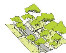
4. La rue Lagattu