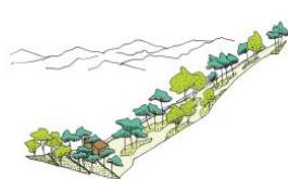
1. La terrasse du parc Malbosco