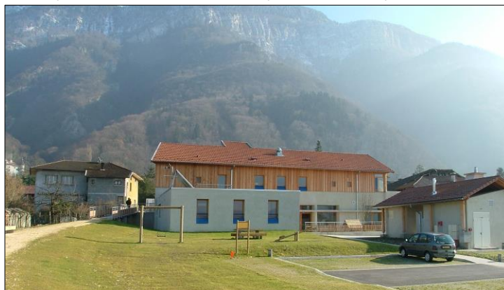
Vue coté parc – coté arrière du restaurant