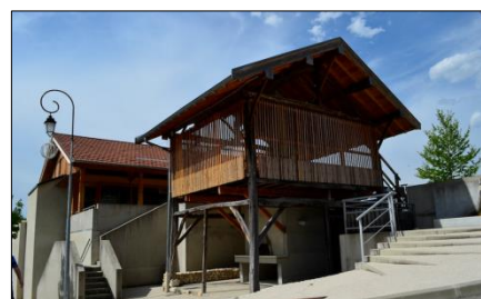
Parc / Place centrale et cours d'eau / Chaufferie bois / Séchoir à noix