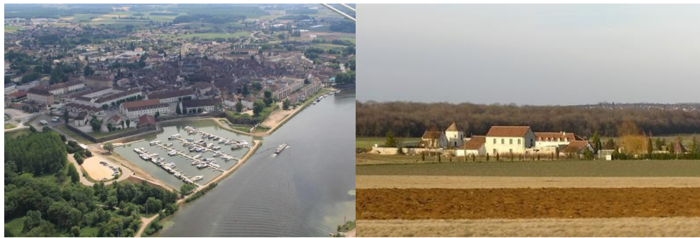
PHOTOS DU TERRITOIRE