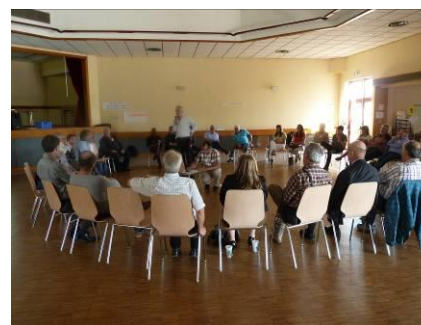
ANIMATION D'ATELIER (VIZEA)