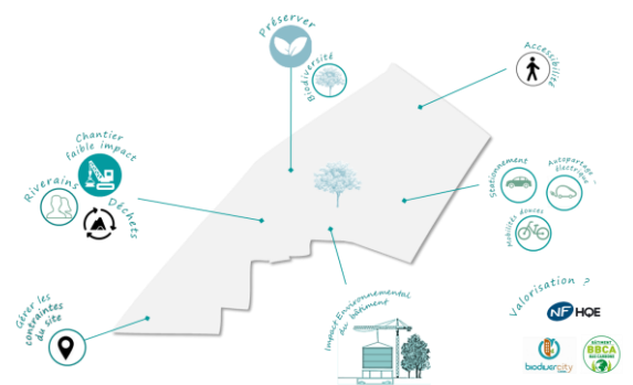
Synthèse de développement durable de la ZAC des Coteaux d'Ormesson (Vizea)