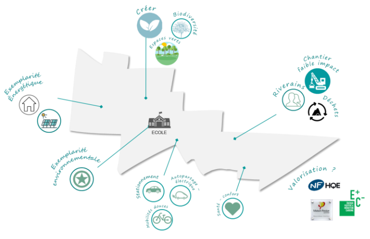
Synthèse de développement durable de la ZAC de la Plaine des Cantoux (Vizea)