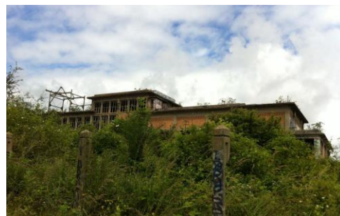
Diagnostic – Site actuel