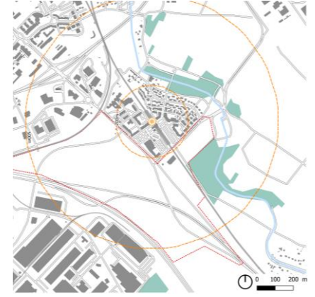
Site actuel – Diagnostic (Vizea)

Favorisant le développement de la croissance du territoire, le projet de la Liesse participe au rééquilibrage des grandes fonctions urbaines à l'échelle de l'agglomération. La ZAC de la Liesse II s'inscrit dans un projet plus global de constitution d'un nouveau quartier autour de la Gare RER à travers l'opération Liesse I déjà réalisée et Liesse III à terme. L'ensemble de ses opérations recherchant un bon équilibre entre attractivité économique et vie de quartier en développant un quartier mixte offrant logements, commerces, activités et équipements de quartier. Vizea a été chargée d'intégrer les enjeux de développement durable au sein du projet.