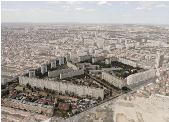
Vue aérienne du quartier des Agnettes à Gennevilliers