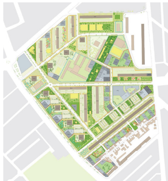
Plan masse du projet urbain (MG-AU Michel Guthmann – 2015)