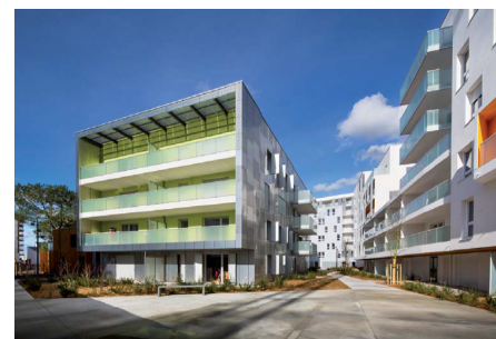
Exemple de logements sur Bordeaux

Pour répondre au fort développement de la ville d'Avignon, la ZAC Bel Air sera un nouveau quartier attractif à la fois pour de nouveaux habitants mais aussi pour les activités tertiaires et des équipements scolaires. L'enjeu majeur est d'insérer ce quartier en le reliant au centre ville tout en profitant des espaces naturels proches