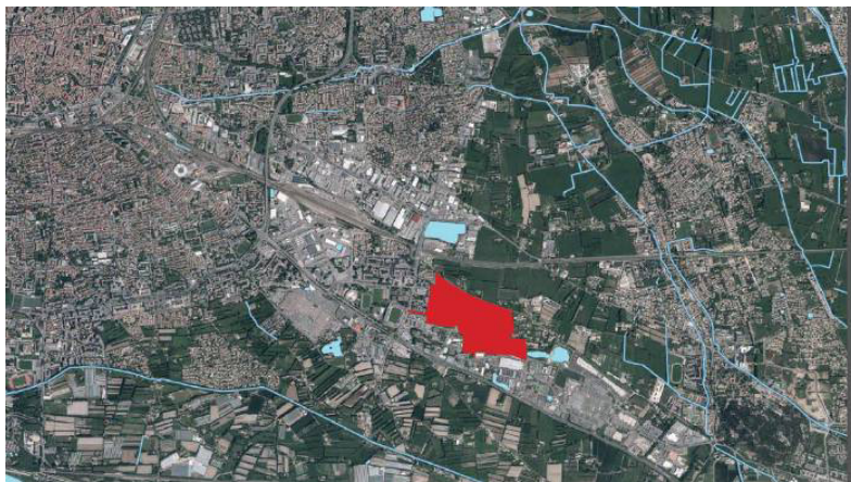
Positionnement de la ZAC au sud-est du centre historique de la ville