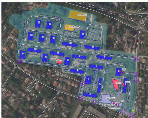
Plan masse de la résidence