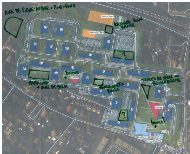
Annotation des participants au cours des ateliers