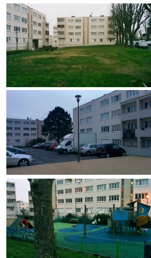
Vues du quartier

Dans le cadre de la réhabilitation sociale d'une partie des bâtiments de la résidence de Viosne à Osny, Emmaüs-Habitat le bailleur social du quartier, souhaite intégrer les habitants à sa démarche urbaine.