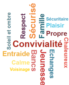
Réflexion participative sur le lien social (Source : LesEnR)

Cette étude intervient en parallèle d'une étude d'ingénierie sociale à l'échelle du bâtiment, réalisée par la société Le Frêne et également accompagnée par LesEnR.