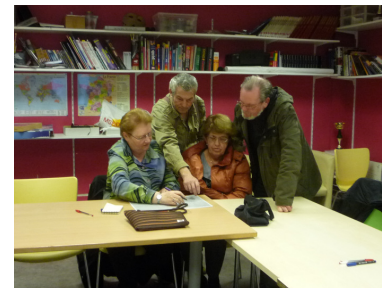
Déroulement des ateliers