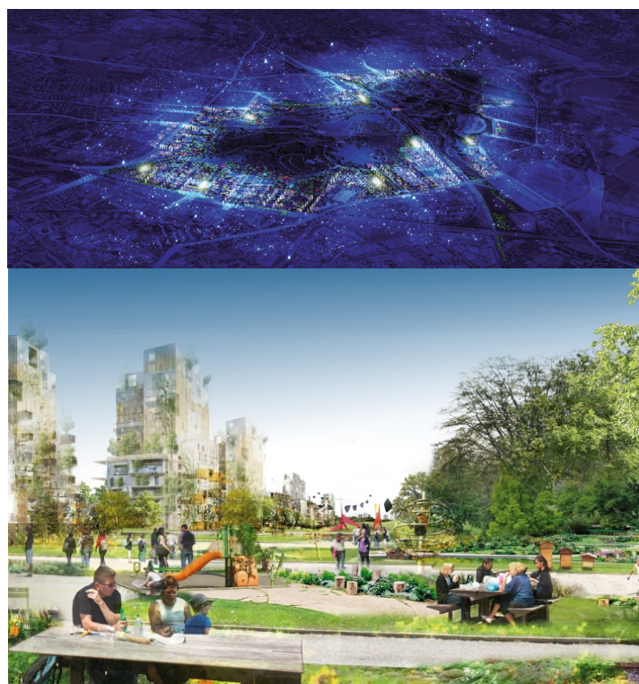
Une lumière dans le grand Paris