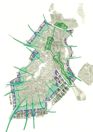
Une gradation entre milieu urbain et milieu naturel – Source : Cdu – Castro – Denissof & Associés – LesEnR