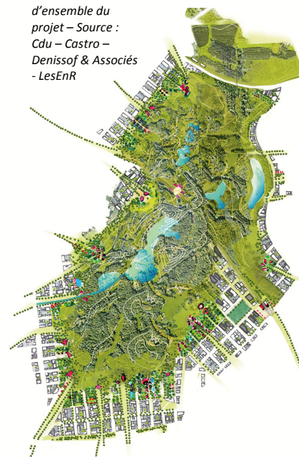
Scénario d'ensemble du projet

Situé sur les franges du Parc Georges Valbon (417 ha) en Seine-Saint-Denis, le projet de Central Park a été initié par l'atelier Castro Denissof & Associés. Mené aujourd'hui en collaboration avec CDU et LesEnR, il crée un nouveau pôle urbain au cœur du Grand Paris.