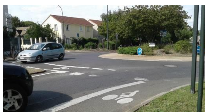
Photographies issues du terrain « en roulant » de Vizea à Montigny-lès-Cormeilles, avec les services de la ville