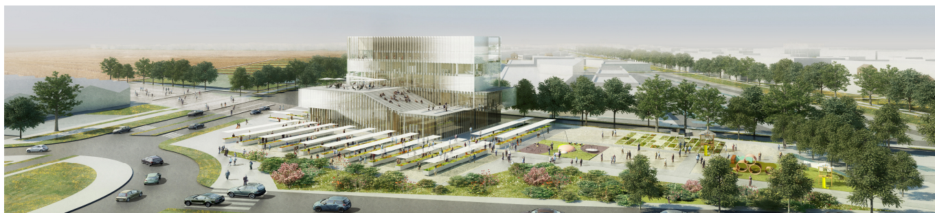
Cité Val Vert (vue depuis le Rond point de Bondoufle), Cité dédiée à l'habitat durable

Le projet Val Vert Croix Blanche, porté par l'agglomération du Val d'Orge et la SORGEM, est destiné à accueillir des programmes d'activité et de commerces liés à l'habitat intelligent et durable. Cette réalisation doit être le reflet de l'ambition d'exemplarité et a, en particulier, abouti à l'élaboration d'une Charte de développement durable. Première opération et premier équipement public de la ZAC, la Cité Val-Vert en particulier sera entièrement dédiée à l'habitat durable.