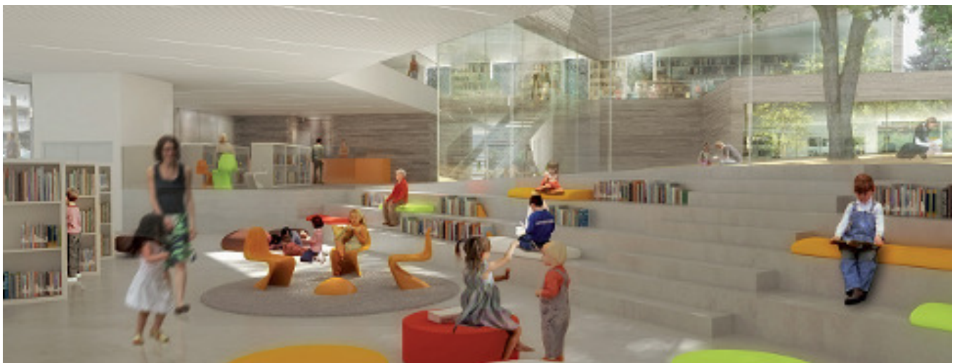
Vue intérieure avec patio extérieur en arrière plan – Phase Concours

Ce projet de médiathèque prend place au sein d'une réflexion de renforcement du pôle culturel central de la ville de Bourg-la-Reine. Mené dans le but d'obtenir une certification HQE®, la conception du bâtiment vise notamment à créer un environnement confortable et sain pour les usagers tout en limitant la consommation des ressources et les impacts du bâtiment sur l'environnement extérieur.