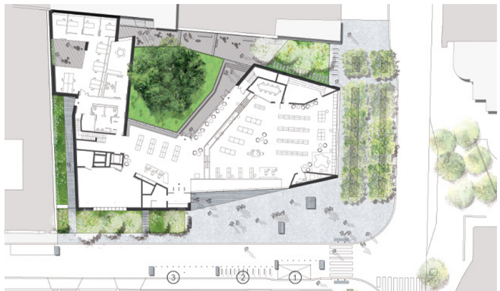
Plan paysage – version APD