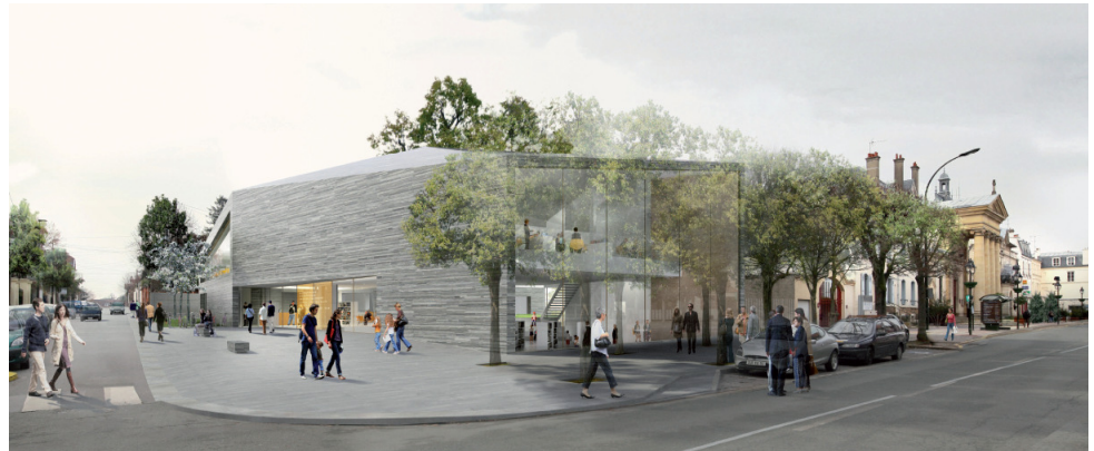
Vue depuis le boulevard Carnot et de la rue le Bouvier