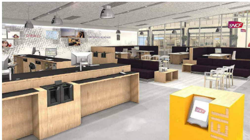
Hall de l'espace e vente