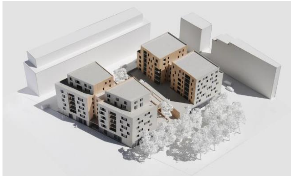
Perspectives de la crèche et des logements

Cette crèche prend place au sein d'un programme d'aménagement plus large entrepris par l'OPH Paris Habitat sur la parcelle située au 120, Rue des Poissonniers dans le 18 ème arrondissement. Mené dans le cadre d'une démarche HQE®, le projet prévoit la mise en œuvre d'un équipement présentant de hautes performances environnementales et énergétiques en accord avec le profil environnemental défini par la Direction des Familles et de la Petite Enfance (DFPE) pour l'ensemble des crèches parisiennes.