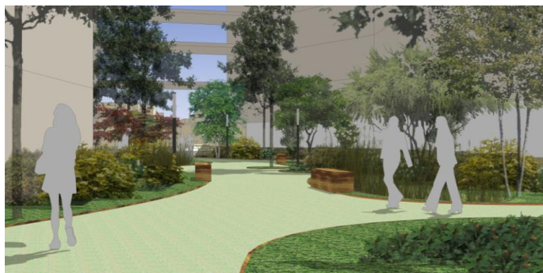
Ambiance du sillon