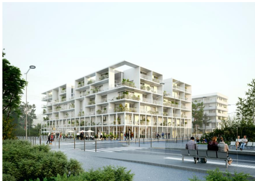
Perspective depuis le maille

Maitre d'Ouvrage : Vinci Immobilier Groupement : Dream - Vinci Immobilier - Eiffage Immobilier AMO/BE Construction Durable : LesEnR MOE : Lambert & Lenack ; Landact Surfaces : 7100 m 2 Calendrier : PC : Mi 2016 - Livraison : 2019