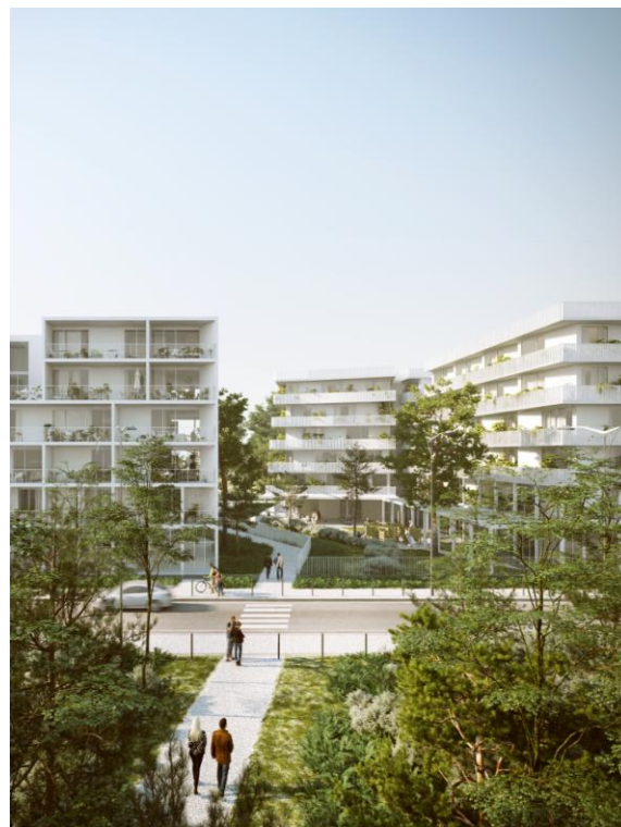
Vue du sillon