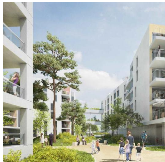
Vue du sillon