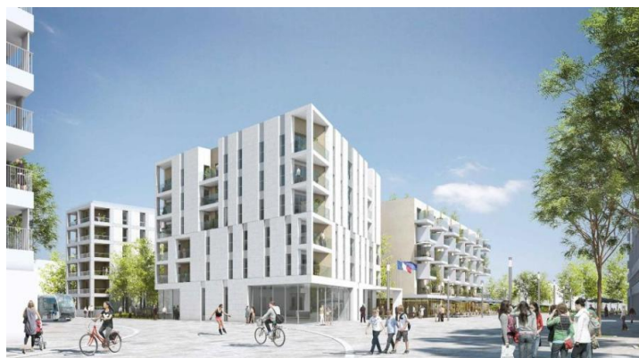
Vue du mail