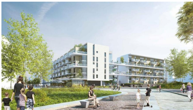
Perspective depuis le parc du Moulon

Le périmètre Ouest du quartier Moulon fait partie des premières réalisations mises en œuvre dans le cadre de la ZAC du Moulon et, à plus grande échelle, du réaménagement du Sud du plateau de Saclay. Il représente l'une des premières pierres d'une vaste opération d'aménagement à travers laquelle se déclinent des enjeux à la fois territoriaux, urbains et architecturaux qui serviront de référence pour le développement de l'ensemble de cette zone.