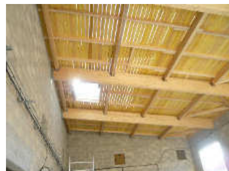
Vues du chantier