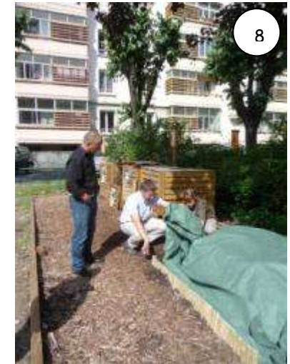
Compostage et maturation sur l'un des sites de compostage en pied d'immeuble à Chambéry Métropole

La mise en place des sites de compostage partagé n'est possible que grâce à la mise en œuvre d'une volonté politique marquée et engagée sur l'ensemble du territoire et grâce à la participation des habitants. Il est donc essentiel d'associer au cas par cas les structures animatrices d'un quartier ou des groupes d'habitants de maison de quartier, des foyers de jeunes travailleurs, des jardins partagés, des associations... La réussite de ce genre d'opération réside également dans un savoir faire local qu'il est possible d'acquérir par l'expérience du terrain mais aussi par la visite de quelques sites et, si nécessaire, par l'accompagnement d'un formateur.