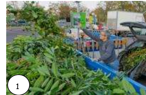
Dépôts de déchets verts en déchèteries

Le compostage domestique des déchets organiques est une vieille pratique qui a été peu à peu délaissée avec le développement de l'habitat résidentiel. De manière à relancer et stimuler cette pratique, l'ADEME a lancé fin 2006, un plan national de soutien au compostage domestique. De très nombreuses collectivités, avant et après le lancement de ce plan ont encouragé les habitants à prendre eux-mêmes en charge leurs déchets compostables. En une dizaine d'années, plus d'un million de bacs à compost ont été distribués à diverses conditions par les collectivités aux ménages dans le cadre de campagnes de promotion.