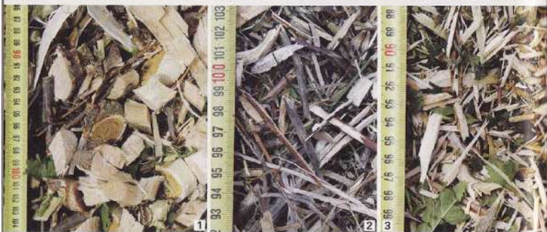
Les trois systèmes de broyage donnent des qualités de broyat très différentes. 1 - Petits tronçons et chapelets de bois frais pour Bosch, à utiliser en paillage. 2 - Broyat plus fin, mais petits brins intacts pour Viking. 3 - Broyat bien défibré pour Eilet.

Internet. Il ne s'agit pas ici de bas de gamme. Avec un moteur puissant, un système de broyage très robuste qui ne tourne qu'à 40 tours/mn et ne nécessite pas d'affûtage, ce type de broyeur s'affranchit très bien des réseaux de spécialistes en moticulture.