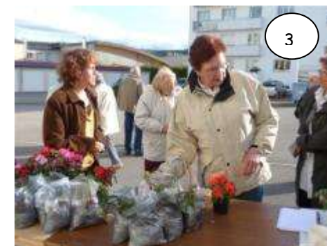
1 ère distribution de compost issu du compostage partagé – SYDOM du Jura

Pour les semis et jeunes plants seul le compost mûr est préconisé. Au jardin ce dernier est utilisé pour couvrir les sillons ensemencés : sa couleur foncée accélère le réchauffement.