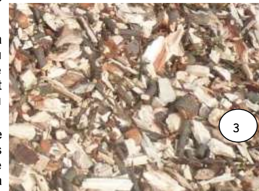
Copeaux : peu absorbant en humidité, mal adapté aux produits très humides

La problématique de l'accès au co-produit risque de devenir cruciale. De plus en plus, les collectivités conservent leur broyat pour leurs besoins en paillage (elles sont obligées souvent d'en acheter à l'extérieur) et les entreprises cherchent à valoriser