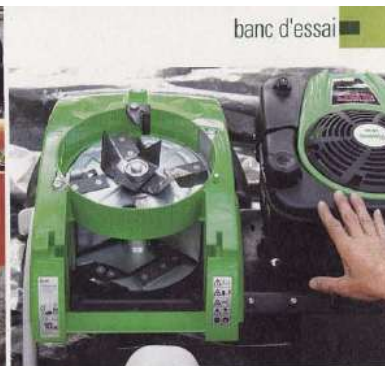
Changement de grille sur l'Eilet Maestro (à gauche). Deux chambres de broyage sur le gros Viking GB 460 (ci-dessus).

Avec des tailles de haies fraîches, on obtient même de longues guirlandes de tronçons mal séparés, surtout avec le modèle à rotor (25 D). Il est donc préférable de laisser le bois sécher un peu avant de le broyer. Dernier point, ces appareils sont impossibles à démonter ; heureusement, vos témoignages montrent que la fiabilité est au rendez-vous. L'agrément d'utilisation de ce type de broyeurs, bien meilleur que pour les deux autres familles d'appareils, fait presque oublier que le débit est nettement inférieur.