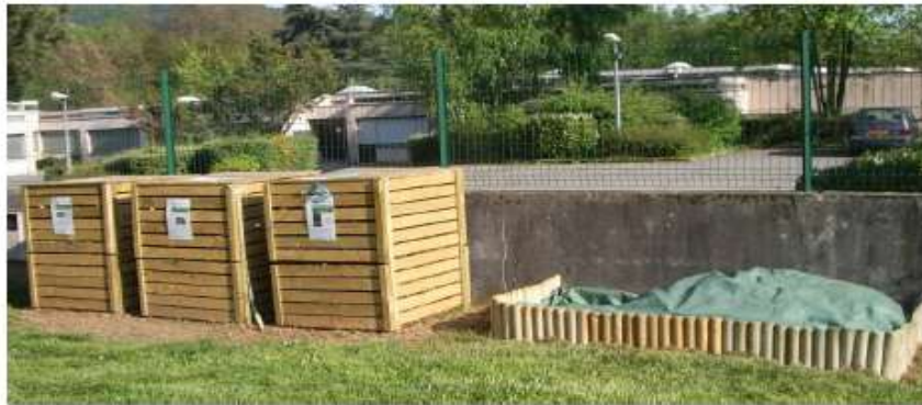
Exemple d'un site de l'agglomération

Pour l'installation d'un site de compostage en pied d'immeuble, prévoir une zone respectant si possible les critères suivants: