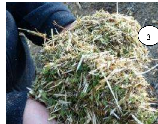
Broyat : excellent structurant et absorbant

Les branches et tailles, cassées, coupées en section de 10 centimètres au maximum ou broyées à la tondeuse offrent une solution intéressante pour les petites copropriétés qui disposent d'espaces verts. Leur disponibilité en quantité suffisante et tout au long de l'année reste toutefois une contrainte forte.